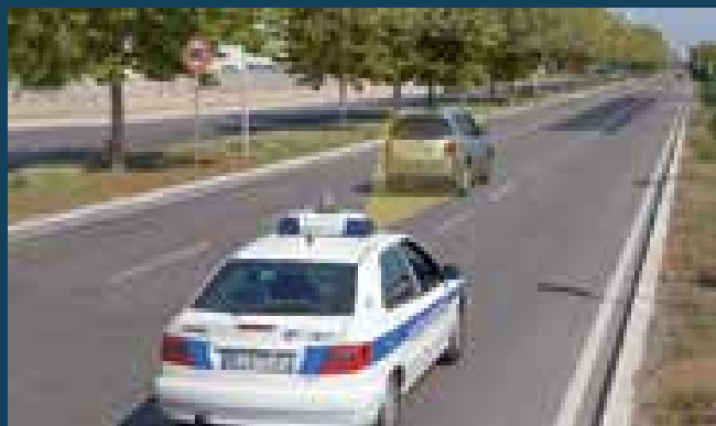
Bersaglio in allontanamento