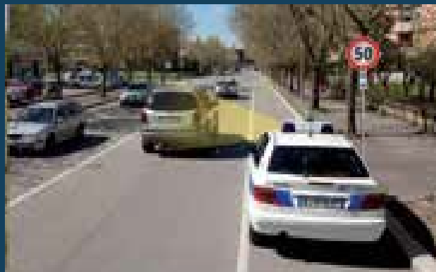
Bersaglio in allontanamento