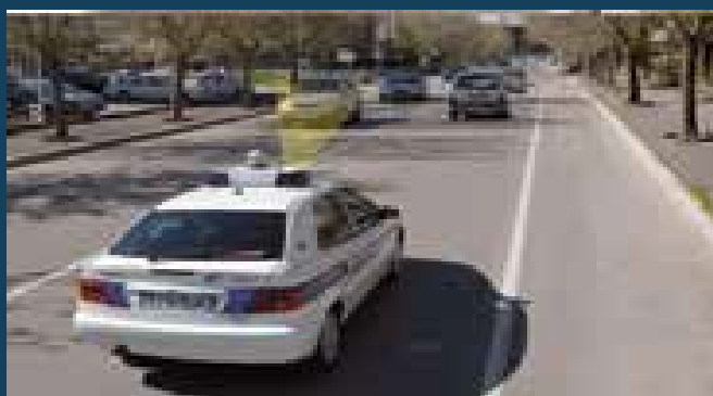
Bersaglio in avvicinamento